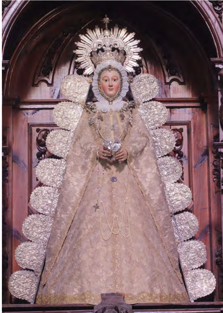
Figura 10. Ráfaga de encajes en plata de la Virgen de la Mesa de la parroquia de Santa María de la Mesa de Utrera (Sevilla), hacia 1700

y José Carlos Tello de Eslava 63 , y que también poseen otras devociones como la Virgen de Belén de Pilas (Sevilla) y Santa María de la Mesa de Utrera (Sevilla) (fig. 10) 64 .