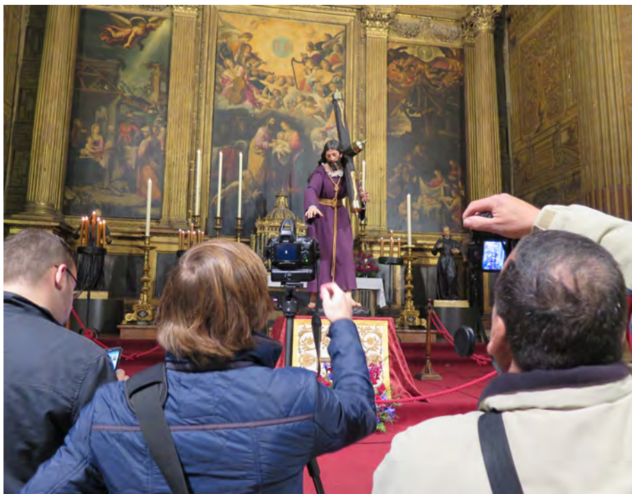
Figura 12. Imagen fotografiada como signo de valoración por determinados grupos sociales

sociedad propietaria y custodia de estos bienes. Esta interrelación obliga paulatinamente al diálogo y a la participación razonada en el seguimiento y desarrollo de un proyecto de esta envergadura. Durante las reuniones o comisiones de trabajo, se deja constancia de los acuerdos, las decisiones tomadas o las sugerencias, siendo estas un medio para documentar los procesos y ofrece una gran base de datos de información para el futuro.