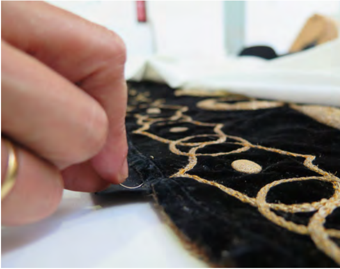
Figura 10. Detalle de un proceso de intervención en obra textil

encuentra en continua evolución. Solo comprendiendo la relación directa entre todos estos condicionantes se podrá determinar las acciones que requieren. Además, los resultados obtenidos tras un proceso de estudio, en muchos casos, sirven de aplicación a otros proyectos, por lo que se produce una transferencia de conocimientos y una mejora para futuras intervenciones, hecho que resulta clave para la sostenibilidad de estas medidas conservativas. Esta es la base de la filosofía para la intervención en el IAPH, el conocimiento como éxito de su metodología de actuación.