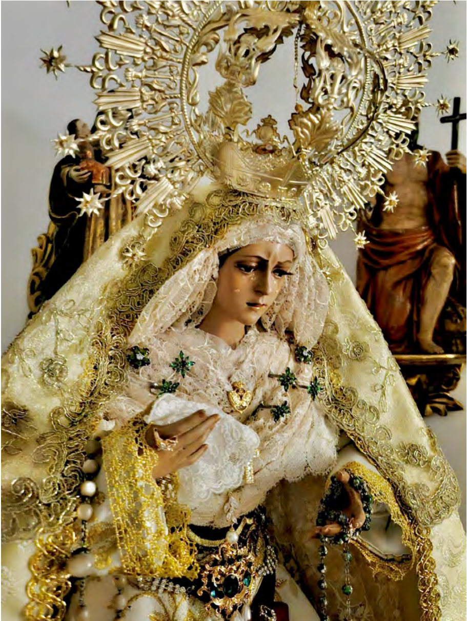
Figura 6. Virgen de la Esperanza Macarena de Lima