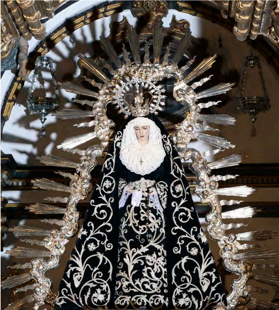
Figura 16. Damián de Castro, ráfaga de la Virgen de la Soledad de Écija, 1765

incorporarán a su iconografía. Estos elementos fueron la aureola de sol, la media luna a los pies y las estrellas en la corona. De las aureolas o ráfagas rodeando toda la imagen tenemos excelentes conjuntos que se reparten por toda Andalucía, destacando especialmente los ejecutados durante el periodo rococó. La ráfaga más sobresaliente es sin duda la realizada por Damián de Castro para la Virgen de la Soledad de Écija (Sevilla) hacia 1765 (fig. 16), al asumir la plasticidad y blandura de la rocalla en una aureola de donde nacen unos rayos biselados que le dan un sentido de verdadera aparición celestial 88 . La repercusión