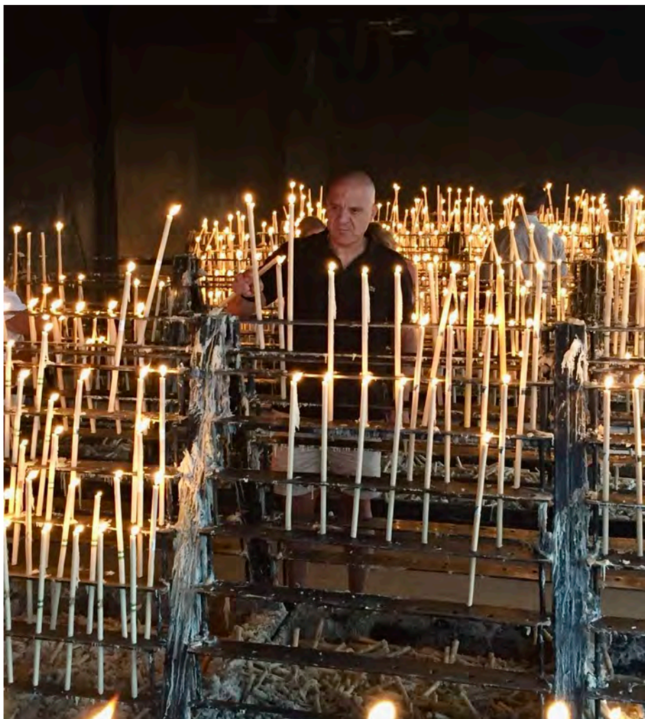
Figura 7. Ejemplo de veneración y devoción

Por otra parte, hay que comprender la naturaleza cultural de estos bienes devocionales. Tal como ya se apuntado anteriormente, existe una relación de pertenencia identitaria con el pueblo que le otorga valores y significación (fig. 7). Sin embargo, esta consideración no es permanente y lo que hoy puede estar cargado de devoción, en otro momento puede cambiar debido a la continua evolución de su interpretación 6 . La sociedad por tanto juega un papel crucial para el reconocimiento, interpretación y valor de su patrimonio y cómo tal forma parte de las medidas derivadas de los procesos conservativos.