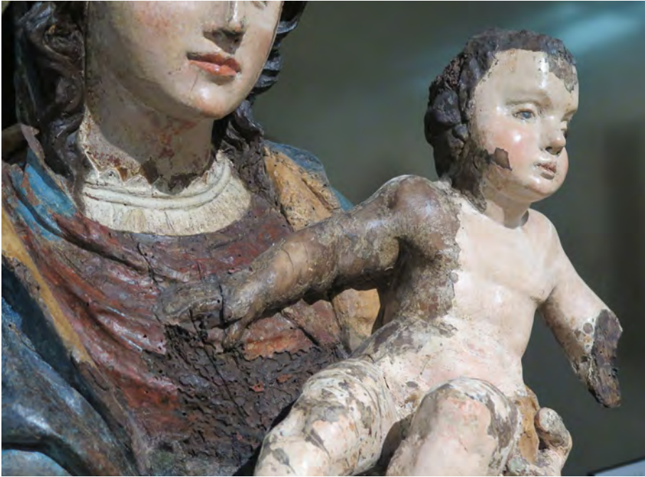
Figura 13. Detalle del estado de conservación de una imagen

cada vez más, se toman decisiones acertadas de conservación por parte de los grupos que custodian este patrimonio y que como tales tienen que proteger.