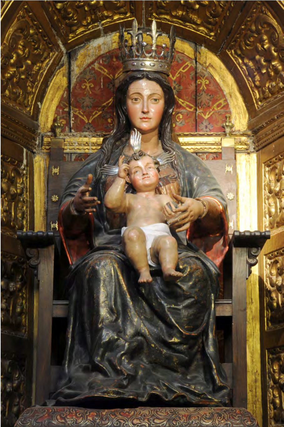
Figura 2. Virgen de la Victoria. Iglesia de Santa Ana. Sevilla