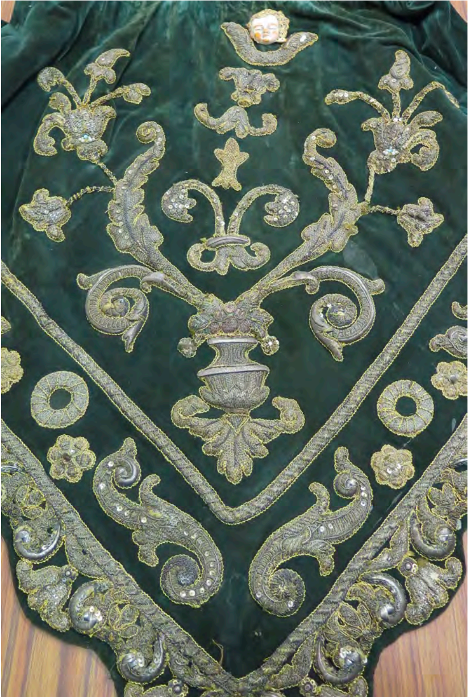
Figura 9. Pasado de bordado con modificaciones en el diseño