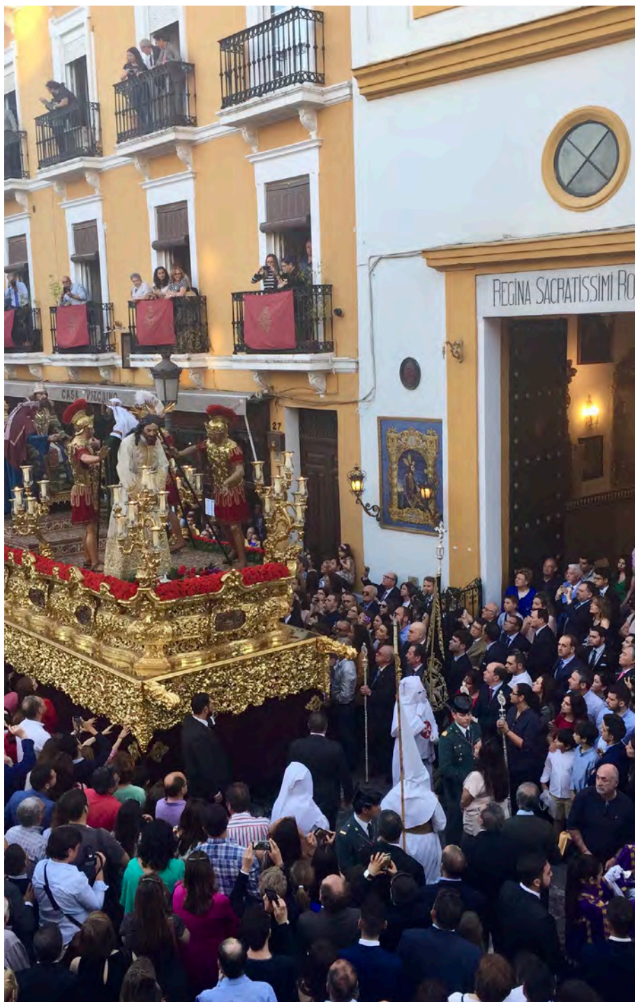
Figura 6. Paso de Cristo en su salida procesional