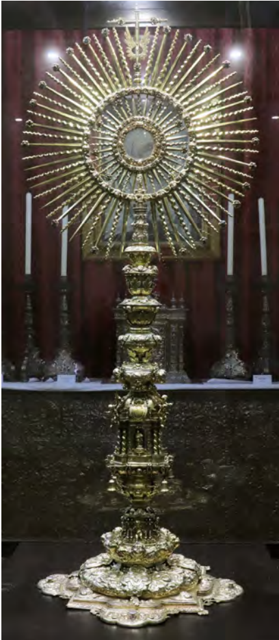
Figura 4. Juan Laureano de Pina, custodia de sol de la parroquia de San Miguel de Jerez de la Frontera, 1674

nuestros días, con obras que intentan emular estilos antiguos, especialmente prevaleciendo el estilo neobarroco.