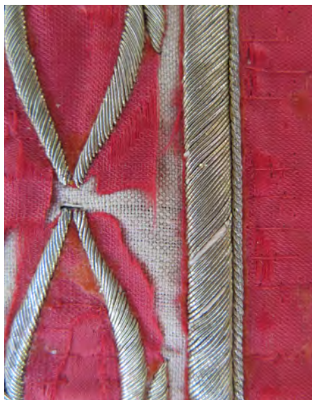
Figura 17. Detalle de lagunas en un soporte textil

A este respecto se encuentran los controles de temperatura y humedad, recomendaciones de manipulación o de anclaje de la ornamentación no artística de la obra en su uso procesional. En este campo se engloban las tareas de mantenimiento y prevención, tanto de bienes del patrimonio procesional que