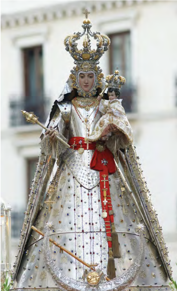
Figura 9. Vestido en plata de la Virgen del Rosario del monasterio de Santa Cruz el Real de Granada, 1628

en 1671 por los duques de Medinaceli 61 . Una tradición que no faltó tampoco durante el siglo XVIII, singularizado en el caso de la Virgen de la Candelaria de la catedral cordobesa, recubierta de plata por Damián de Castro en 1757 62 .