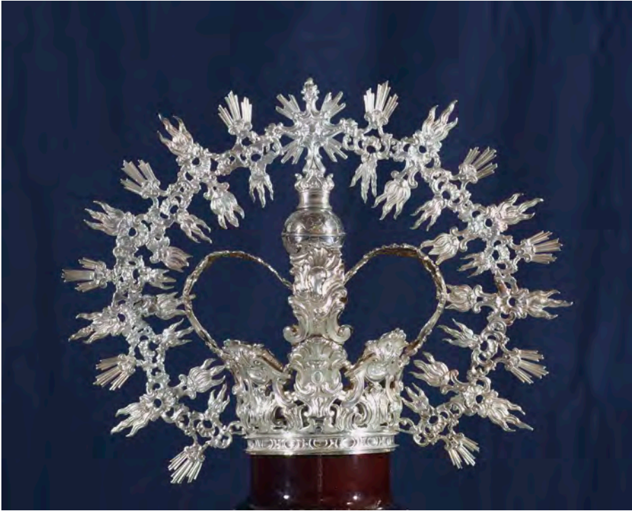
Figura 15. Damián de Castro, corona de la Virgen de la Soledad de Écija, 1765

canónica andaluza y será en 1904 cuando sea coronada la Virgen de los Reyes, quien recibió una elegantísima corona regia, de inspiración medieval, labrada en oro, con piedras preciosas y esmaltes, por los orfebres Pedro Vives y Ferrer y Manuel de la Torre 78 . La segunda advocación en recibir este reconocimiento fue la Virgen de la Cabeza de Andújar (Jaén) en 1909, para lo cual se confeccionó una riquísima corona de oro y pedrería de tipo imperial que desapareció en 1936 79 .