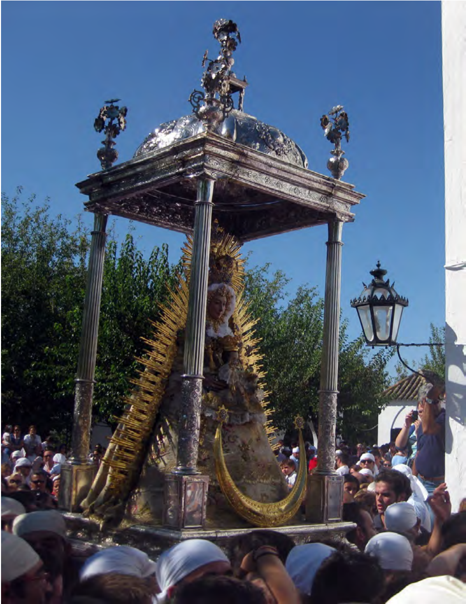
Figura 19. Diego Gallegos, andas de la Virgen de Setefilla, 1690

de la Caridad de Sanlúcar de Barrameda (Cádiz), por presentar unas columnas torsas ejecutadas en ébano con pámpanos de plata y una cúpula calada, obra comenzada en 1608 y reformada hacia 1700 98 ; unos soportes que se repiten en las