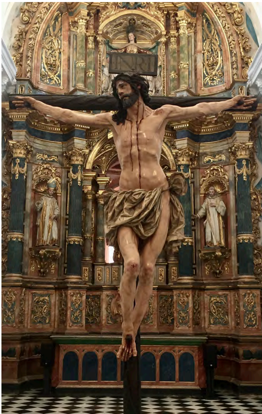
Figura 1. Cristo de la Agonía. Juan de Mesa. Bergara (Guipúzcoa)