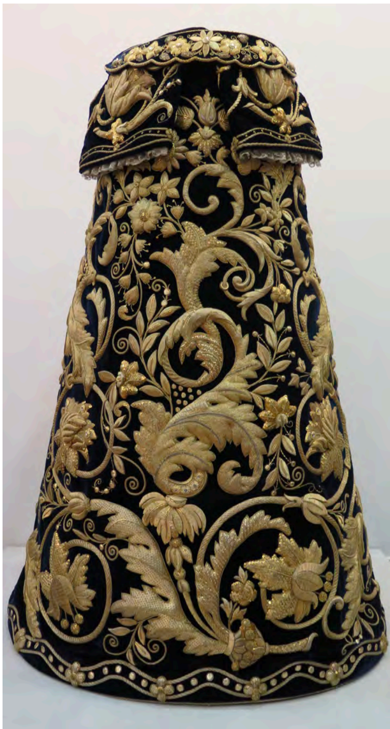
Figura 18. Exposición de saya de Virgen