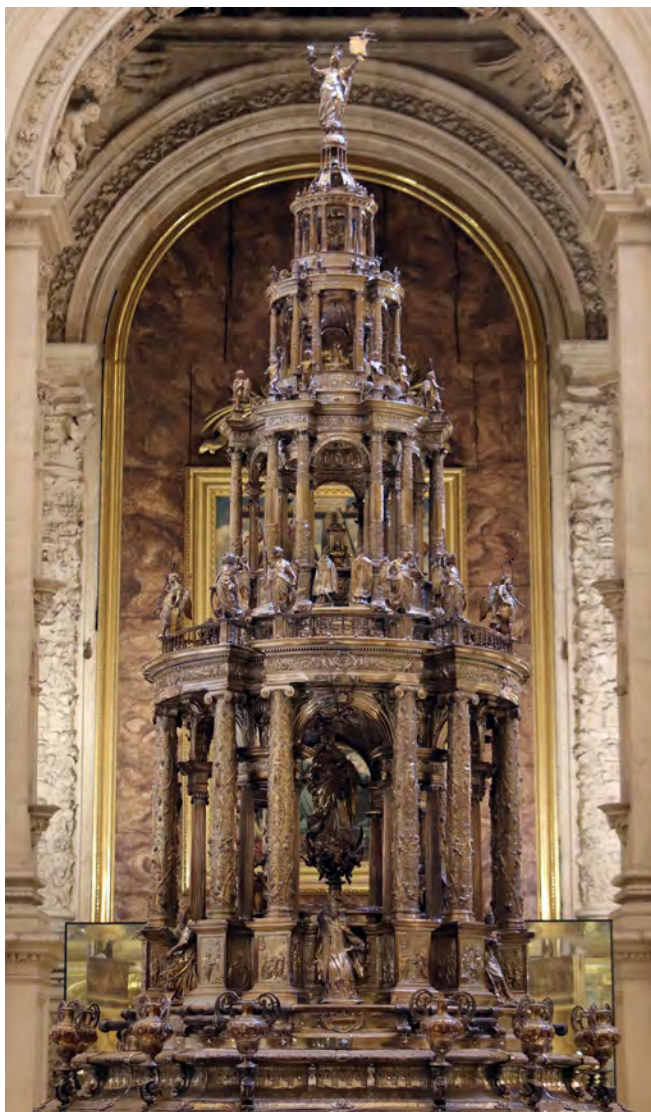
Figura 2. Juan de Arfe, custodia de asiento de la catedral de Sevilla, 1587

custodias de asiento para poblaciones de menor entidad, como la desaparecida en estilo rococó de la parroquia de San Miguel de Morón de la Frontera (Sevilla), creación de José Alexandre y Ezquerro de 1764, considerada la de mayor altura de todas las que se habían labrado hasta el momento y cuya arquitectura se difuminaba entre motivos de rocalla (fig. 3) 11 . Una tendencia estética que terminará con la llegada del rigor académico, el cual hará que