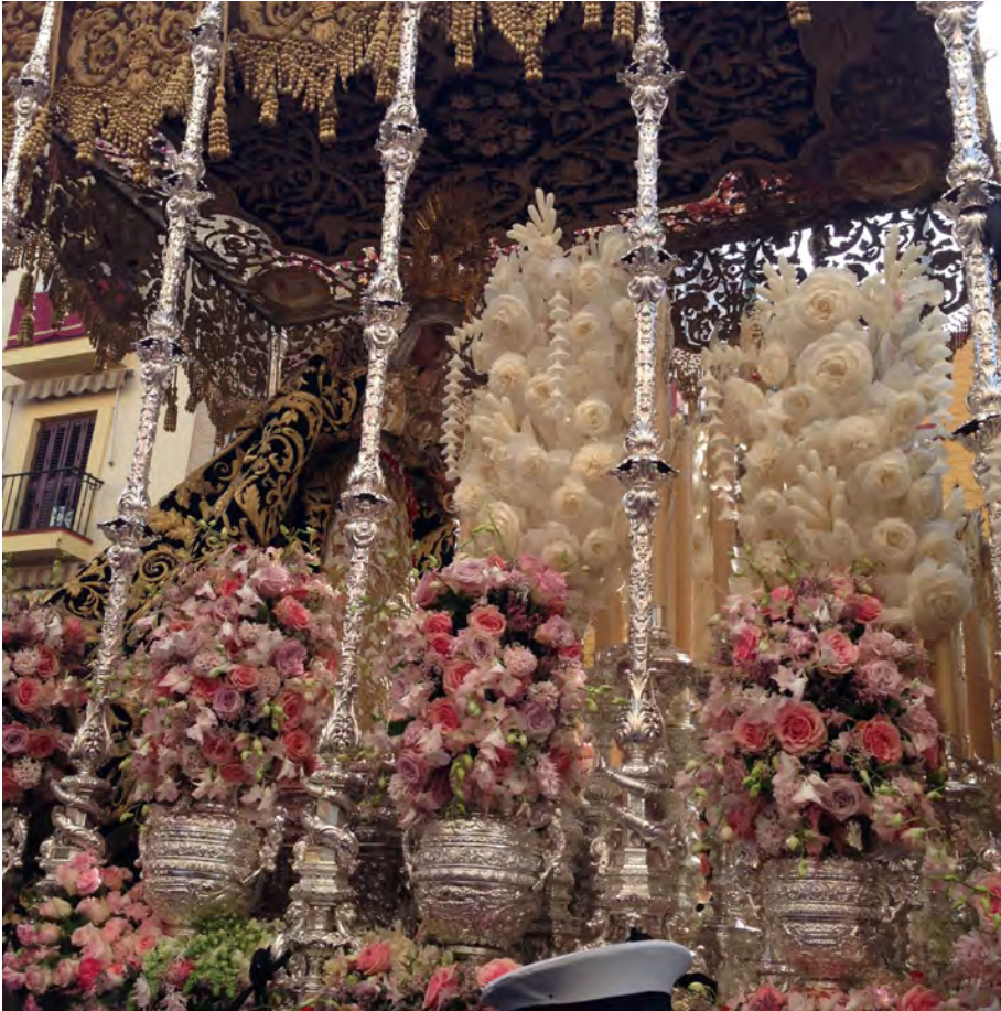
Figura 14. Acto procesional de un palio

contemplación y lo que evoque a la mayoría de las personas a los que va dirigido, es decir, se debe tener en cuenta el porcentaje del grupo social que asume este bien como propio y centro de su devoción. Con ellos hay que establecer un diálogo abierto de intercambio de información (fig. 15).