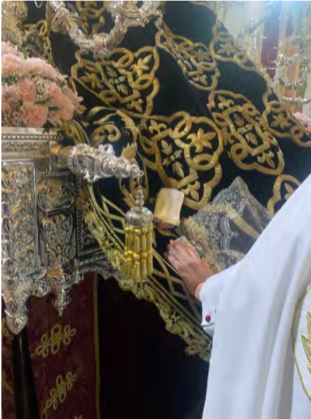
Figura 2. Bienes portadores de devoción