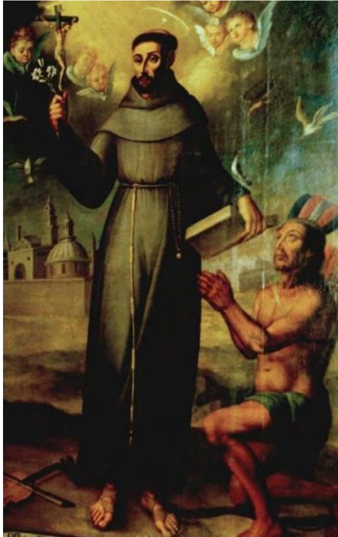
Figura 4. San Francisco Solano predicando a los indígenas. Museo de Arte Lima

quien fue preconizado a la diócesis de Chiapas en 1544. Entre estos cabría destacar al lojeño fray Alonso de Montúfar, segundo obispo mexicano e impulsor de importantes medidas de gobierno en su jurisdicción, como la convocatoria de los dos primeros concilios provinciales. La existencia de determinadas piezas de raigambre dominica en diferentes acervos manifiesta ya en el período barroco el interés de los religiosos por hacer propaganda de las virtudes de algunos de sus miembros peninsulares. Un retrato y un panegírico de procedencia sevillana en museos de México y Puebla de los Ángeles demuestran la intensa campaña desarrollada para lograr la canonización de la Venerable Madre Dorotea, monja del convento de Santa María de los Reyes de Sevilla. En