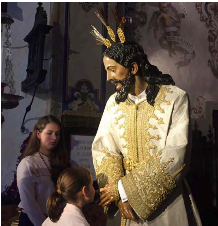
Figura 4. La imagen como medio de devoción

superior, como puede ser la Semana Santa u otros rituales (peregrinaciones, romerías y procesiones) 2 (fig. 5). En definitiva, su importancia reside en lo simbólico frente a lo material, en su continuidad a través de las prácticas devocionales, que es una de las razones por las que se mantienen en uso y permanente actualización dentro de la cotidianidad de su día a día.