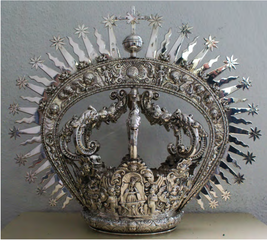
Figura 13. Bernabé García de los Reyes, corona de la Virgen de los Dolores de Osuna, 1747

de traza barroca, como las que labró Ignacio del Villar en 1690 para la Virgen y Santa Ana de la parroquia mayor de Triana (Sevilla) 73 , o la original y rica presea cordobesa de Bernabé García de los Reyes perteneciente a la Virgen de los Dolores de Osuna (Sevilla) de 1747 (fig. 13) 74 .