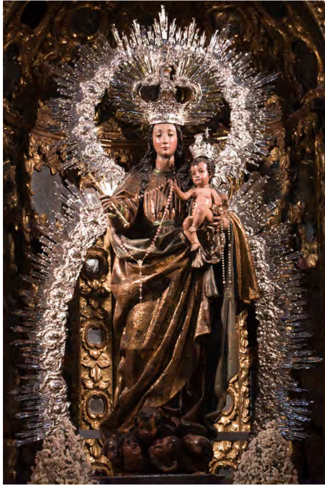
Figura 14. José Alexandre y Ezquerro. Corona y ráfaga de la Virgen del Rosario de la parroquia del Sagrario de Sevilla, ha. 1770

de una versión del Toisón de Oro con rayos (fig. 15) 76 . De hacia 1800 es la corona de oro que labró el zaragozano Vicente Gargallo Alexandre para la Virgen de Gracia de Carmona (Sevilla), una proporcionada pieza de transición al Neoclasicismo 77 .