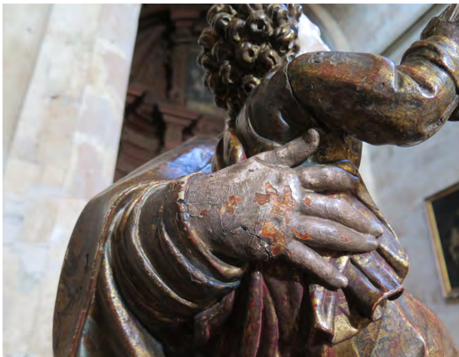
Figura 8. Detalle de repolicromía en una imagen

la información. Otras veces es la falta de documentación por escrito, dejando constancia de hechos o información que puede ser de interés a través de transmisiones orales, basadas en la memoria de los miembros más longevos de una corporación, que con el tiempo se terminan desvirtuando o perdiendo si no se toman las medidas oportunas.