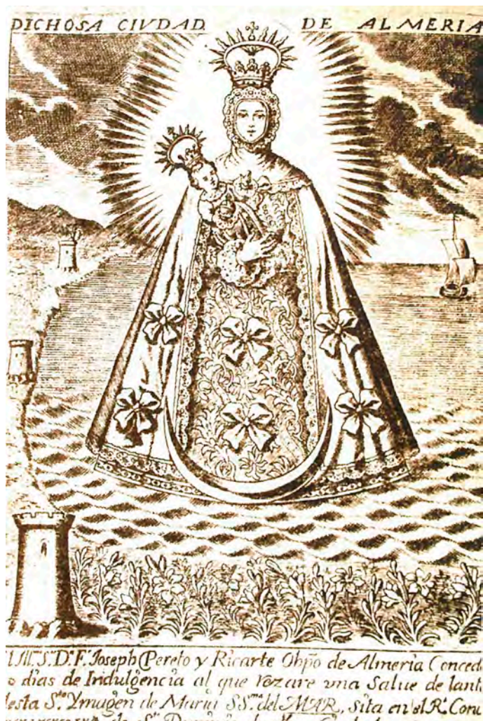
Figura 12. Grabado de la Virgen del Mar de Almería, 1727

su carácter celestial. Unas diademas que en un principio serán sencillas bandas de rayos rectos y flameados, como la que muestra la Virgen del Mar en un lienzo anónimo conservado en la catedral de Almería y en grabados de la época (fig. 12) 71 , pero que pronto se irán enriqueciendo con ornamentos cincelados y esmaltes como sucede con la que donó el portugués Gonzalo Núñez de Sepúlveda para la Inmaculada Grande de la capilla de San Pablo de la catedral hispalense, obra de Luis de Acosta de 1655 72 . Una corona manierista que será modelo para otras que se cubrirán de un aparatoso repujado vegetal