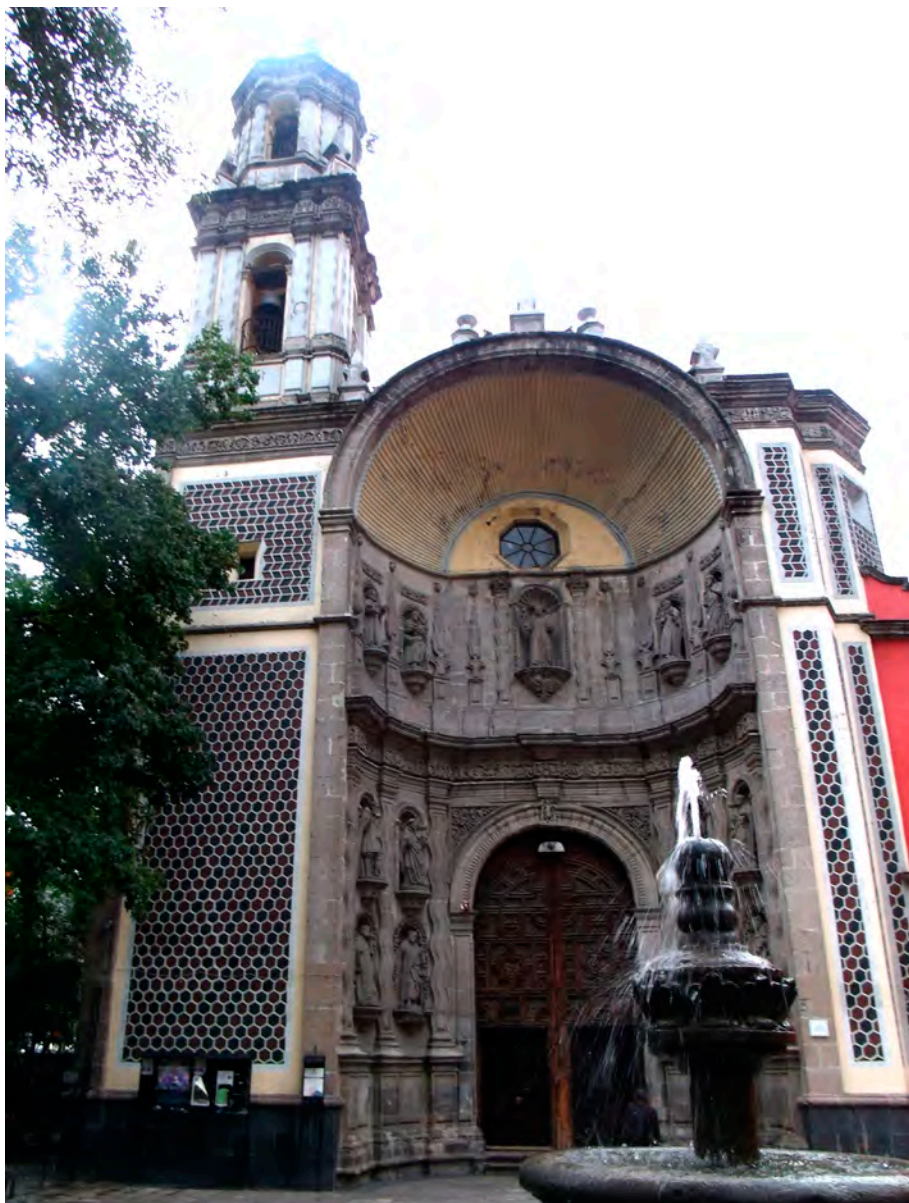
Figura 5. Templo de San Juan de Dios. Ciudad de México

se veneraba en su terruño o la que gozaba de más fama en la región de la que procedían» 17 . Para lograr ese objetivo, los fieles viajaban con numerosas es-