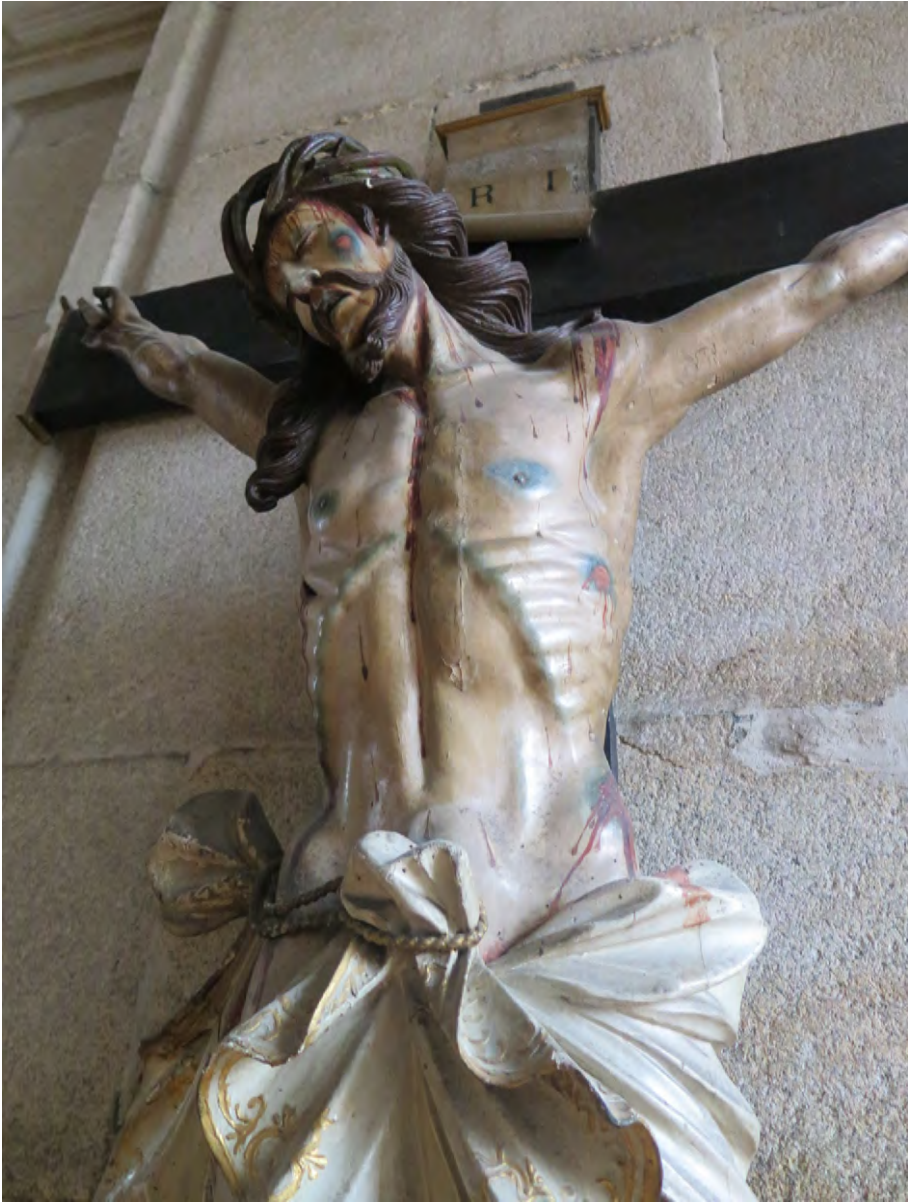
Figura 16. Imagen con intervenciones anteriores

artesanal que a veces puede tener consecuencias cuando se exceden en reconstrucciones y reparaciones, con el fin exclusivo de mejorar la estética y permitir a toda costa la funcionalidad inherente a la creación de la propia obra textil. Siendo consciente de la importancia de la conservación de estas piezas, se están desarrollando estudios e investigaciones relacionadas con la