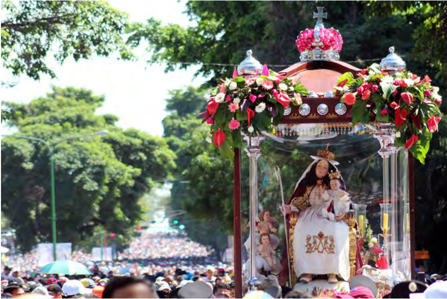
Figura 3. Procesión de la Divina Pastora de Barquisimeto (Venezuela)

han asegurado personas fidedignas, las mismas coplas que en Sevilla se le cantan. Y esto todo en el corto espacio que media desde el año 1704 hasta el año 1720, que es una maravilla que en tan corto tiempo haya crecido tanto y aumentándose esta utilísima devoción» 12 . La huella dejada no solo ha perdurado en un vasto repertorio de imágenes pictóricas y escultóricas en recintos eclesiásticos e instituciones culturales, sobre todo en la región ecuatoriana, sino que aún hoy pervive en la peregrinación de Suramérica más multitudinaria celebrada cada 14 de enero en la localidad venezolana de Barquisimeto. Con motivo del 150 aniversario de la institución de esta procesión, una delegación de dicha hermandad visitó a la matriz sevillana para hacerle entrega de una réplica de su titular y compartir los festejos de la semana grande de septiembre de 2006 13 (fig. 3).