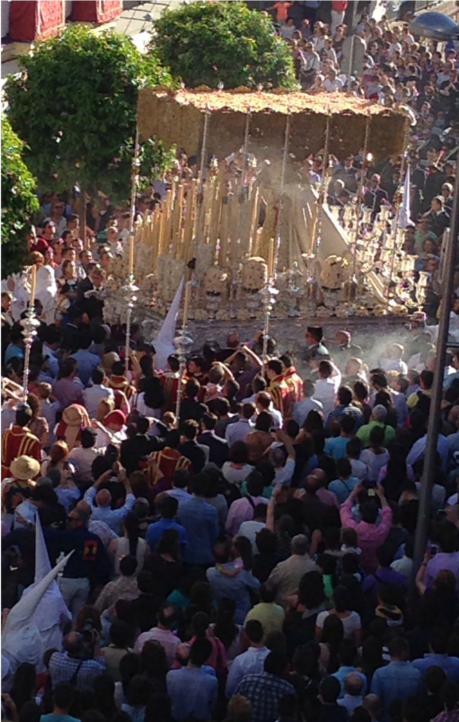
Figura 5. Palio de Virgen en su salida procesional