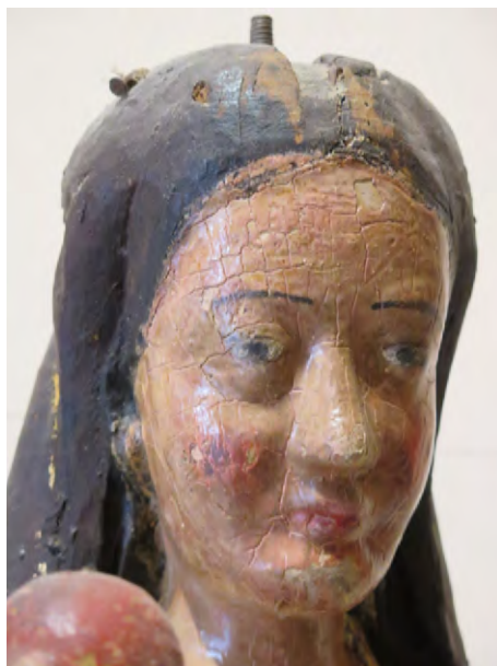
Figura 11. Detalle del rostro de una imagen con graves problemas de conservación

En este ámbito de estudio se encuentra la conservación del patrimonio devocional en culto activo y desde este punto de vista se abordan los procesos de conservación y restauración.