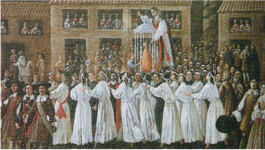
Figura 18. Detalle del lienzo de la Virgen de la Cabeza donde se recrea la procesión de la imagen en las andas de plata. Bernardo Asturiano, 1680

o la de la Virgen de la Cabeza de Andújar (Jaén), cuya pieza actual, obra de Angulo de Lucena, es una réplica de la estrenada para su coronación 94 .