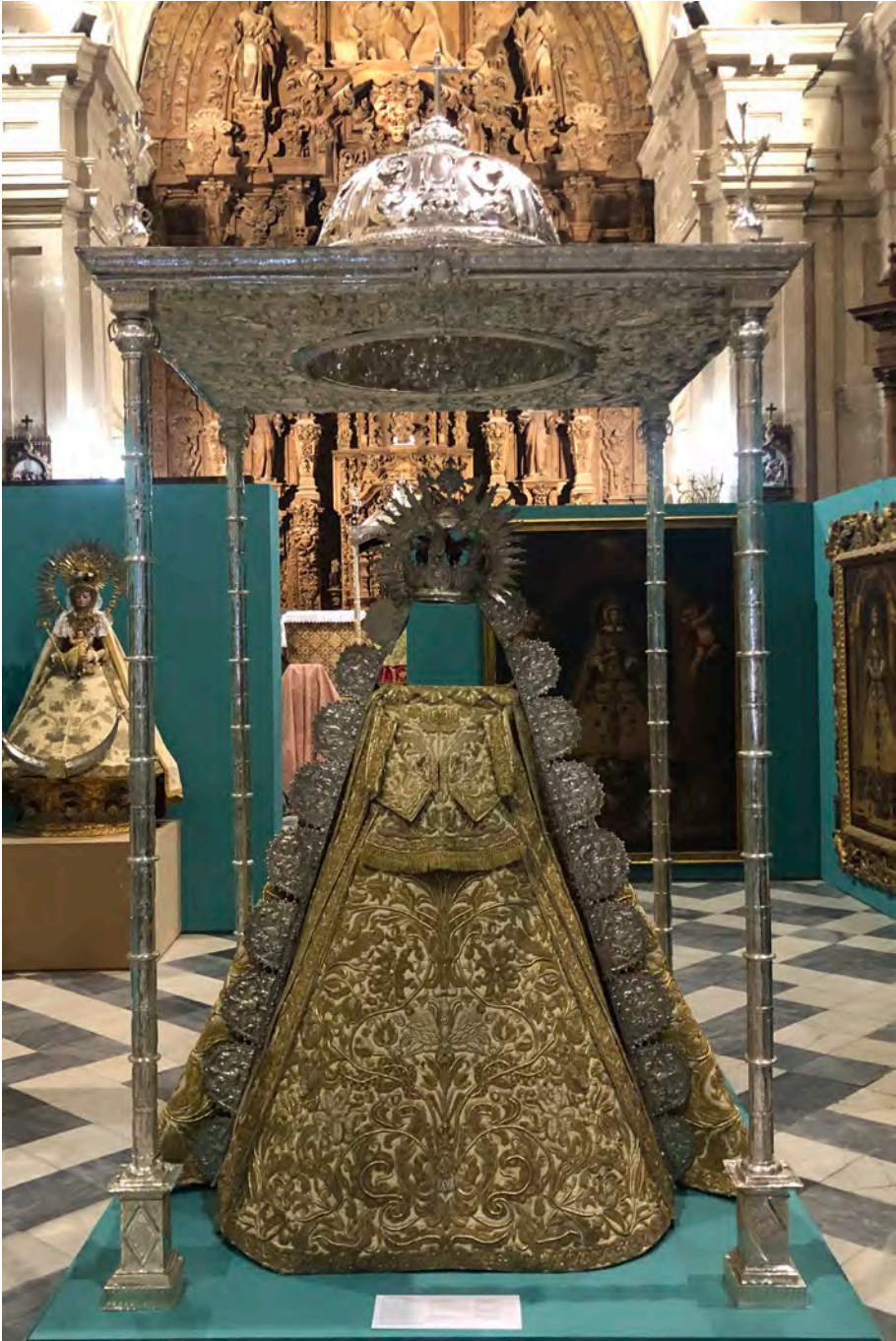
Figura 20. Francisco de Luna, andas de la Virgen de Gracia de Carmona, 1738