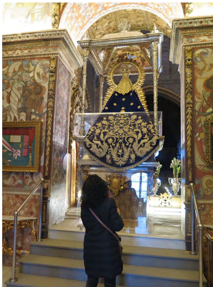
Figura 15. Momento de contemplación y acto de devoción

percepción de una imagen sagrada, que por el hecho de estar barnizada impida apreciarla como preceptivamente se debería observar en su origen de creación. Sirva de ejemplo un Cristo muerto donde no se aprecien los estigmas o las secuelas del martirio, el color verdoso o los relieves del cuerpo, al estar camuflados por capas de barniz que desvirtúen la contemplación de su verdadera significación 11 . Este hecho tiene el mismo efecto con repintes o repolicromías (fig. 16). En estos casos es fundamental el conocimiento del valor inmaterial y simbólico para la comprensión actual de la obra por parte de un determinado grupo, antes de emitir una propuesta.