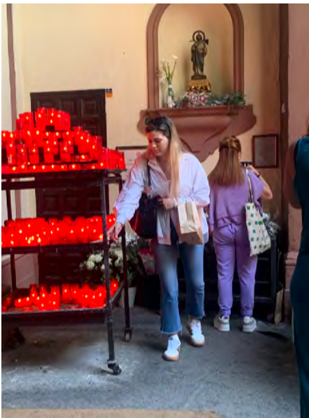
Figura 3. Acto de devoción

que contenga todas las características que lo hacen singulares y únicos, desde el contexto actual 1 .