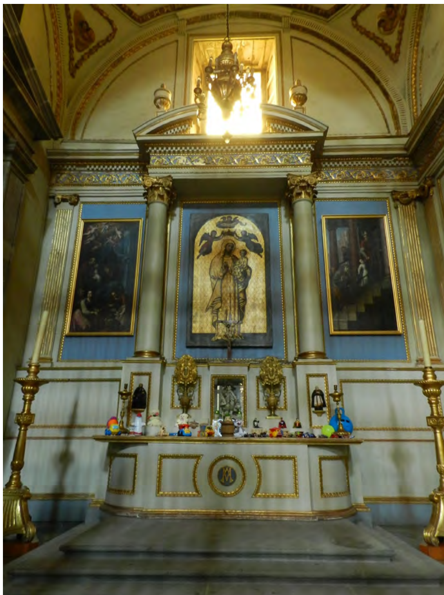
Fig. 1. Virgen de la Antigua. Catedral metropolitana de México

De todas las imágenes anteriormente mencionadas cabe reseñar dos por su trascendencia simbólica. La primera de ellas sería la desaparecida talla de la Virgen de los Remedios que se veneraba en el antiguo convento de carmelitas descalzos al otro lado del río Guadalquivir. En las Religiosas Estaciones del abad Sánchez Gordillo se dice que «es tenida la Imagen, en gran