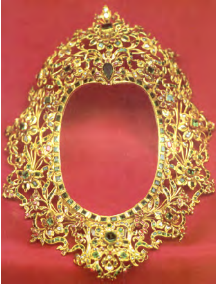
Figura 11. Damián de Castro. Rostrillo de la Virgen del Valle, Écija, 1765

del Valle de Écija (fig. 11) o Consolación de Utrera, todas ellas devociones de la provincia de Sevilla, sin olvidar los de la Virgen de Araceli de Lucena (Córdoba) y la Virgen de los Remedios de Antequera (Málaga) 65 . En otras ocasiones, serán joyas prendidas en las ropas de la Virgen las que adquieran un papel iconográfico de primer orden, como sucedió con la desaparecida cruz de oro con esmeraldas engastadas que donó el arzobispo fray Bernardo Alonso de los Ríos (1677-1692) a la Virgen de las Angustias de Granada, la cual fue un atributo más de su icono dieciochesco 66 ; o el perfumador en forma de barco labrado en oro que Rodrigo Salinas donó en 1575 a la Virgen de Consolación de Utrera, símbolo por